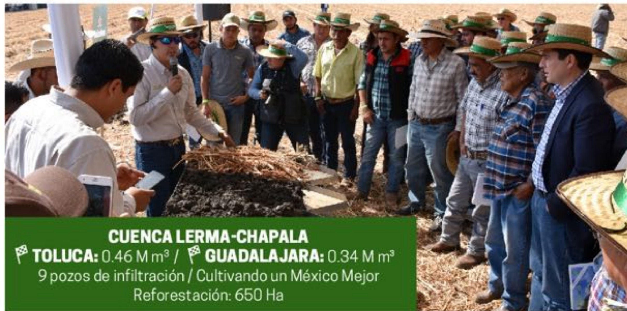
CUENCA LERMA-CHAPALA 🚩 TOLUCA: 0.46 M m 3 / 🚩 GUADALAJARA: 0.34 M m 3 9 pozos de infiltración / Cultivando un México Mejor Reforestación: 650 Ha