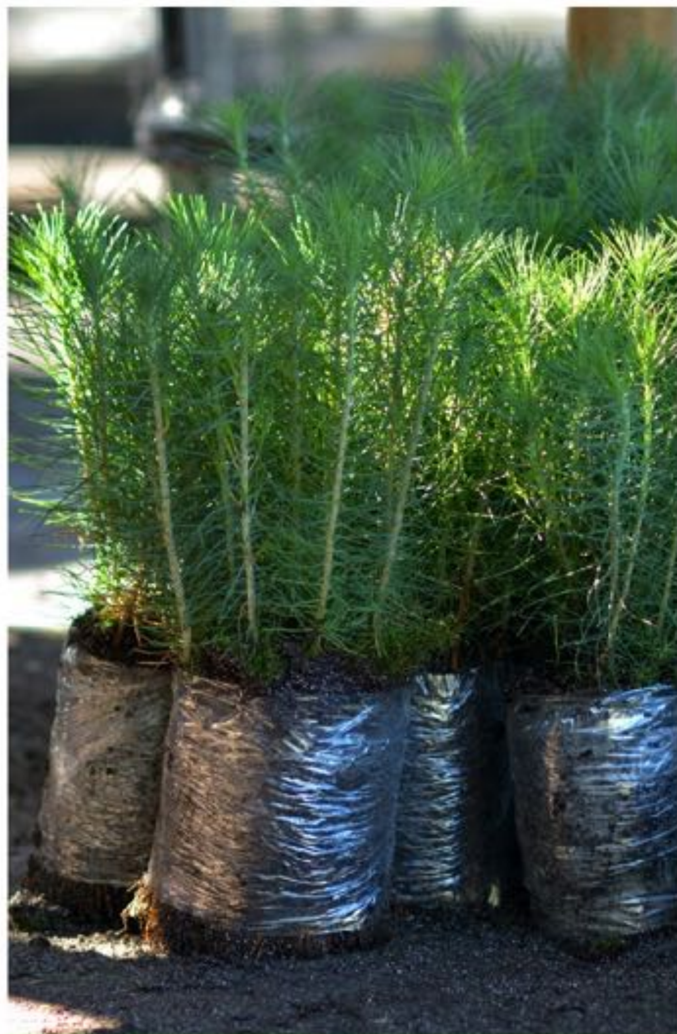
CUENCA RÍO SAN JUAN 🚩 MONTERREY: 1.15 M m 3 Reforestación: 1300 ha